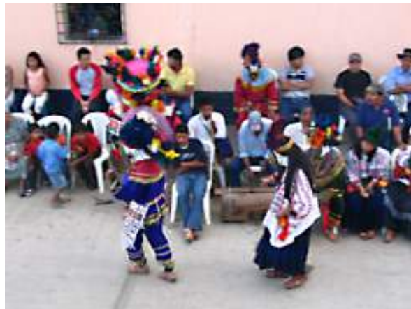
Danza el Rabinal Achí de Guatemala