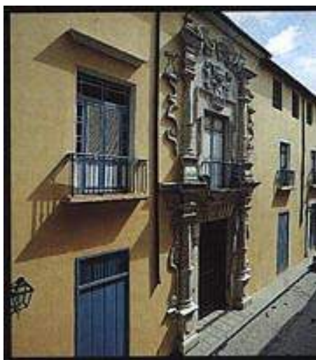
Palacio de Obrapía 158, Centro Histórico de La Habana, Cuba.

Un inmueble patrimonial puede incluir obras de valor artístico cultural en su interior como parte de su diseño, pueden ser: pinturas murales, vitrales, elementos arquitectónicos incluidos en sus decoraciones, etc. Pero también las obras de arte que forman parte de ese inmueble en sus interiores o en parques y jardines. Sin embargo estos objetos artísticos que fueron vinculados intencionalmente al inmueble en su proyección material, técnicamente pueden separarse del muro, o del lugar donde fueron emplazados, pero es importante considerar que implica la pérdida de valores culturales, de significado del bien o degradación. Hay riesgos de pérdida si al bien cultural lo separan de su lugar original, transformándose en consecuencia en un bien mueble .