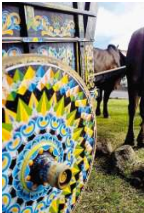
Carretas de Costa Rica

Estas simbolizan la tradición del transporte del café desde el valle central hasta Puntarenas, y tienen manifestaciones artísticas únicas.