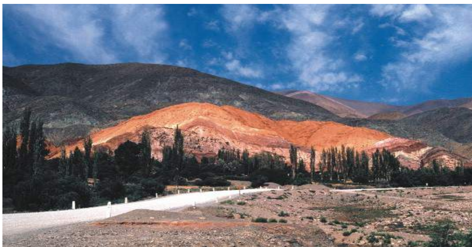
Paisaje de la Quebrada de Humahuaca, Patrimonio Cultural de la Humanidad viviente, Jujuy – Argentina.

En octubre de 2003, la Quebrada de Humahuaca en la provincia de Jujuy, Argentina fue declarada por la UNESCO, "Paisaje Cultural de la Humanidad". La declaración señala Paisaje Cultural evolutivo viviente, vivo, que se manifiesta en una multiplicidad relevante de su cultura e historia, y los componentes de una diversidad de particularidades excepcionales, geográficas y sociales.