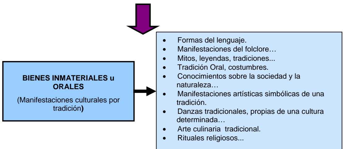
Fig. 1 y II: Tabla de Patrimonio Cultural- Manifestaciones Culturales. Derecho intelectual- Ley 23.412- CAPIF. N° 67899/ 2003. María del Carmen Díaz Cabeza.